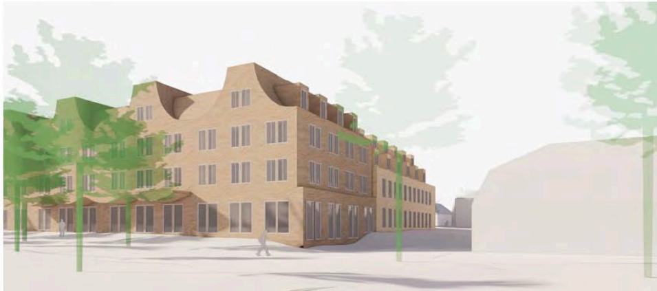
Modellvy sett från nordost som visar exempel på ny kyrkobyggnad i hörnet vid korsningen mellan Landskyrkoallén och Brunnsgatan (Okidoki arkitekter).