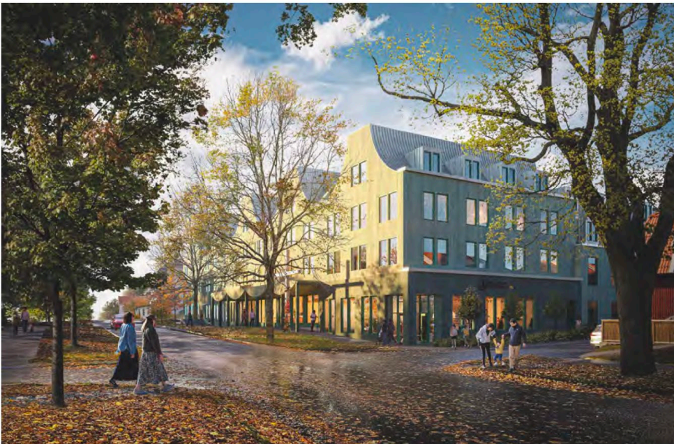
Bilden visar en vy sett från nordost, med Landskyrkoallén i förgrunden, och illustrerar hur den nya kyrkobyggnaden inom Afzeliiskolan 3 kan utformas (Okidoki arkitekter).