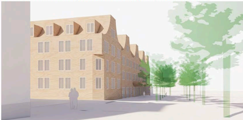
Modellvy sett från söder som visar exempel på ny kyrkobyggnad längs med Landskyrkoallén (Okidoki arkitekter).