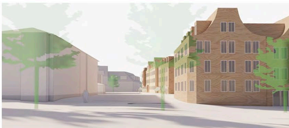
Modellvy sett från öster som visar exempel på ny bebyggelse med ny kyrkobyggnad i förgrunden. Till vänster syns befintlig bebyggelse inom Afzeliiskolan 4. (Okidoki arkitekter).